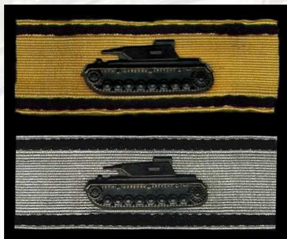
نشان ضد تانک به کسانی اهدا میشده که به تانک حریف نزدیک شده و با مواد منفجره دستی تانک را نابود میکردند. پیشوا در ۹ مارچ ۱۹۴۲ این نشان را طراحی کردند. در دو درجه نقره ای / مشکی و طلایی اهدا میشد، طلایی برای نابودی ۵ تانک و نقره ای برای نابودی ۱ تانک. واحد های ضد تانک نمیتوانستند این مدال را دریافت کنند. (سربازان عادی و رماخت)