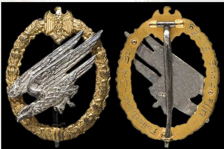
نشان چتربازان ارتش در ۱ سپتامبر ۱۹۳۷ طراحی و در جون ۱۹۴۳ مورد بازنگری قرار گرفت. شرایط گرفتن آن، گذراندن موفقیت آمیز قسمت آموزشی، ۵ پرش مورد تایید و ۶ پرش در سال برای حفظ نشان