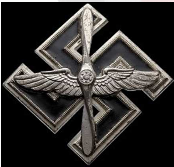
نشان خلبانان اس اس / اس آ به خلبانان اس اس یا اس آ اهدا می شده.